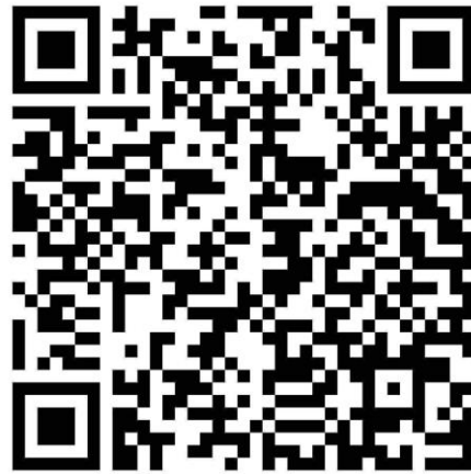
QR Code วัติทัศน์การดูแลตนเองของผู้ที่มีทวารเทียม