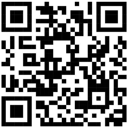
QR Code แผ่นพับให้ความรู้