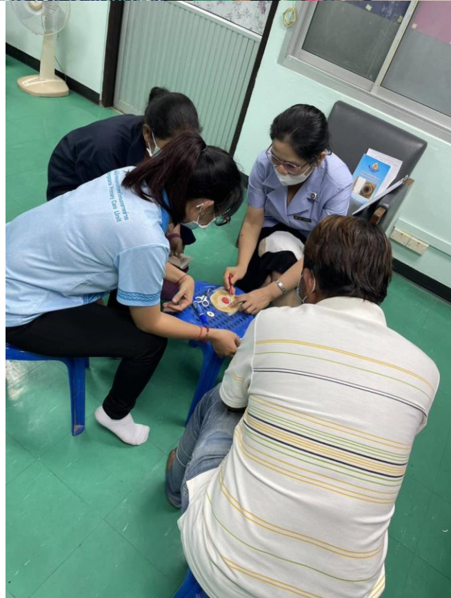
การสอนและฝึกทักษะการดูแลทวารเทียมแก่ผู้ป่วยและญาติที่คลินิก