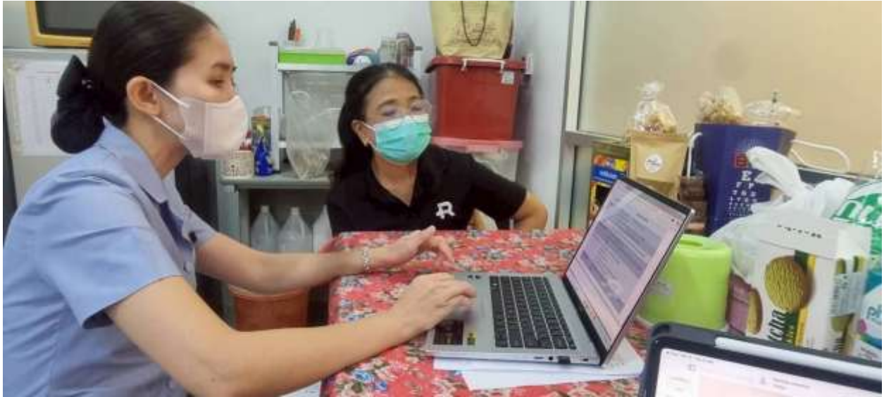
ภาพที่ 3 นำเสนอผลการปฏิบัติงาน และแนวทางการพัฒนางานต่อพยาบาลหัวหน้าแผนก