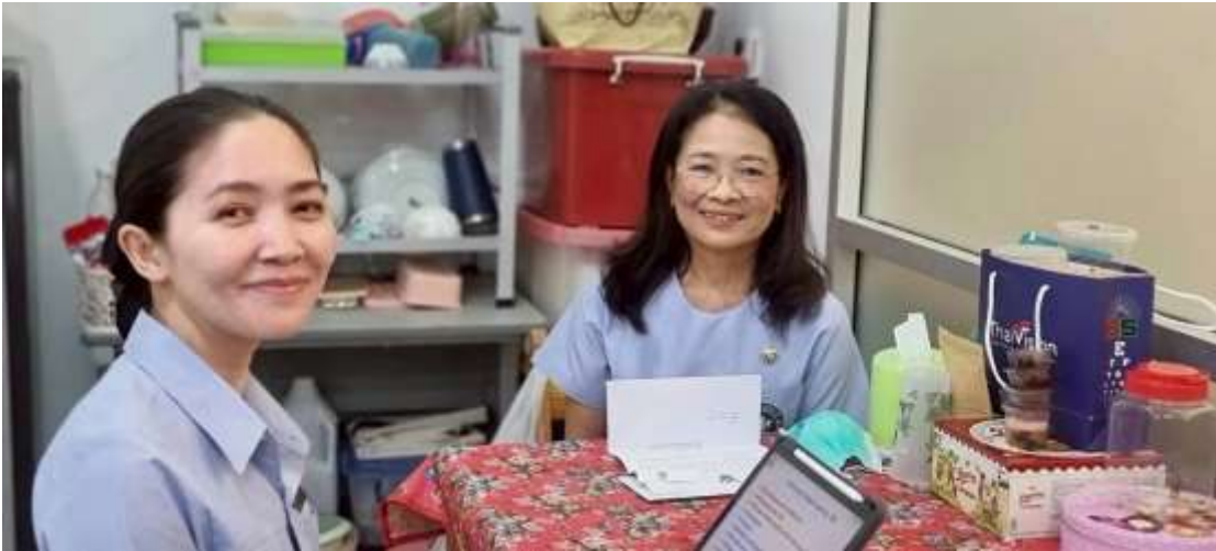
ภาพที่ 1 ซึ่แจงวัตถุประสงค์และนำเสนอแนวคิดการปฏิบัติงานต่อพยาบาลหัวหน้าแผนก

การปฏิบัติงาน Faculty practice ณ แผนกผู้ป่วยนอก กลุ่มงานจิตเวช โรงพยาบาลราชบุรี สัปดาห์ที่ 1 ระหว่างวันที่ 2-3 และ 5 กุมภาพันธ์ 2569