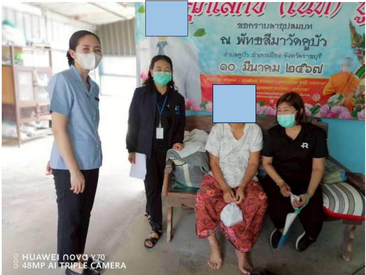
ภาพที่ 5 การเยี่ยมบ้านโรคจิตเภท