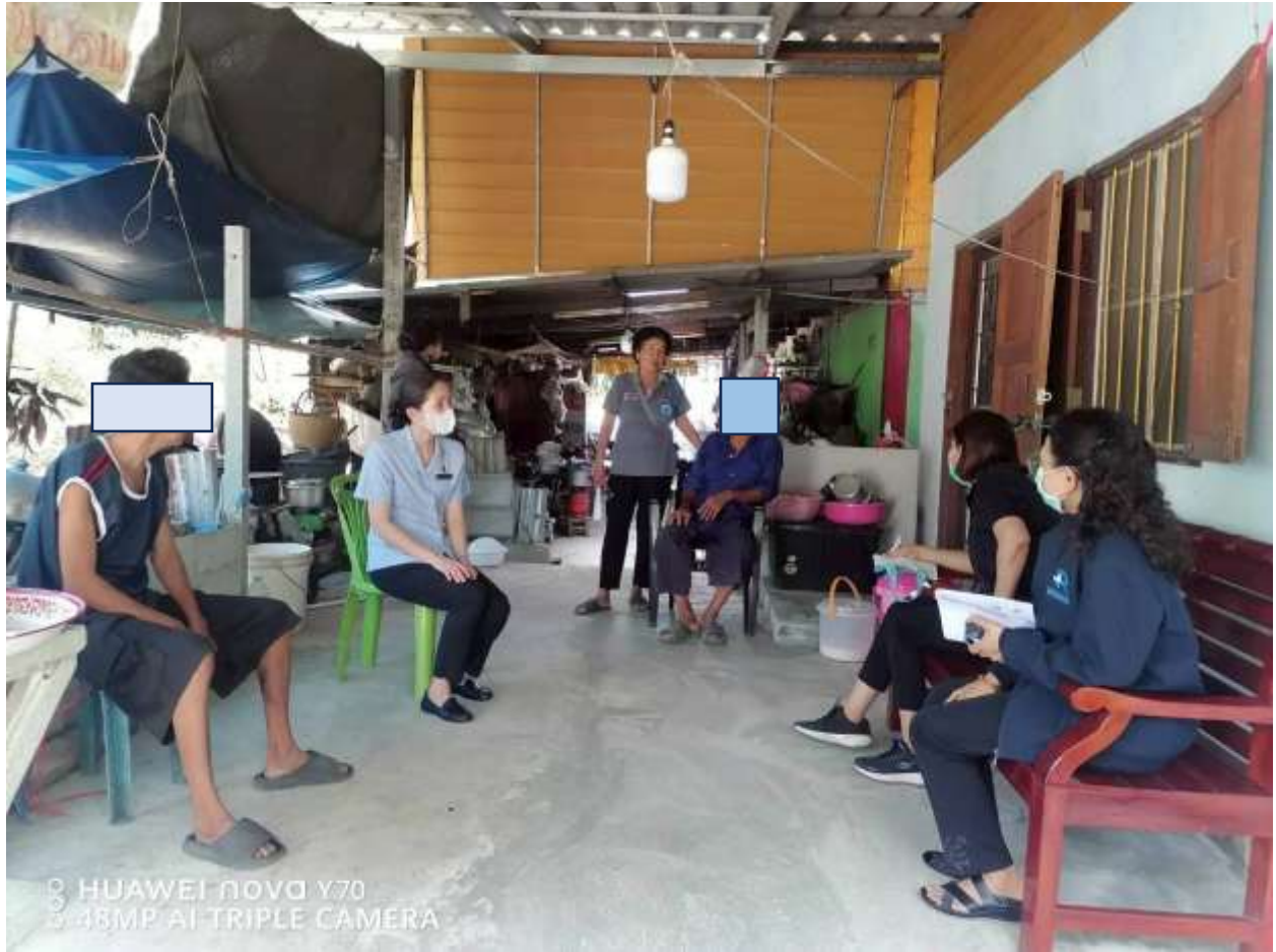
ภาพที่ 6 การเยี่ยมบ้านโรคจิตเภท และผู้ดูแล