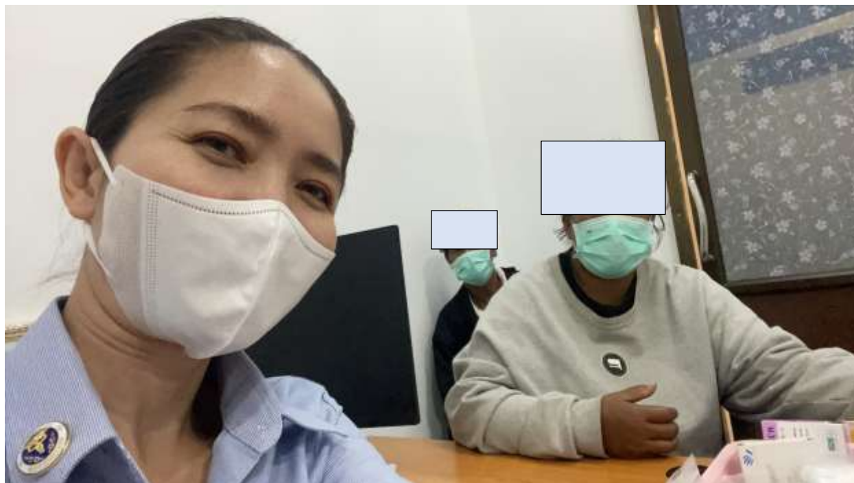
ภาพที่ 4 การให้คำปรึกษาแก่ผู้ป่วยโรคจิตเภทและผู้ดูแล

การปฏิบัติงาน Faculty practice ณ แผนกผู้ป่วยนอก กลุ่มงานจิตเวช โรงพยาบาลราชบุรี สัปดาห์ที่ 2 ระหว่างวันที่ 9-10 และ 12 กุมภาพันธ์ 2569