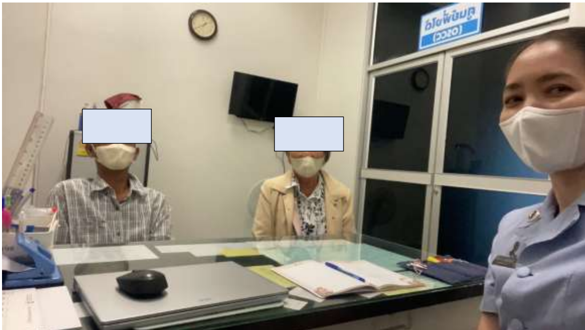
ภาพที่ 2 การให้คำปรึกษาแก่ผู้ป่วยโรคจิตเภทและผู้ดูแล