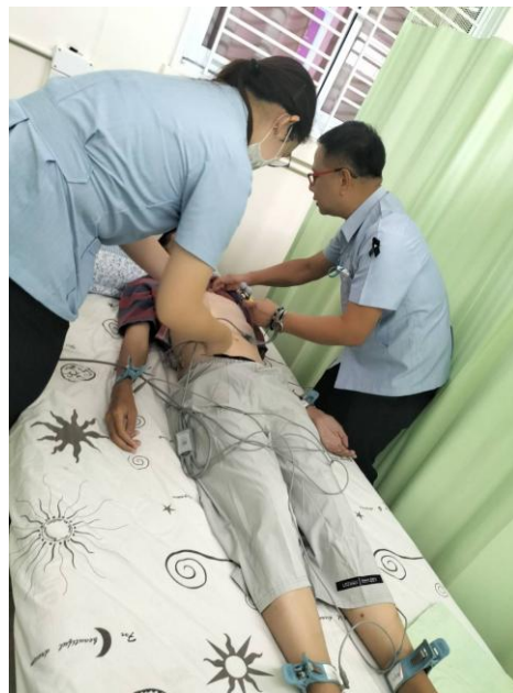
ภาพแสดง การตรวจคลื่นไฟฟ้าหัวใจ