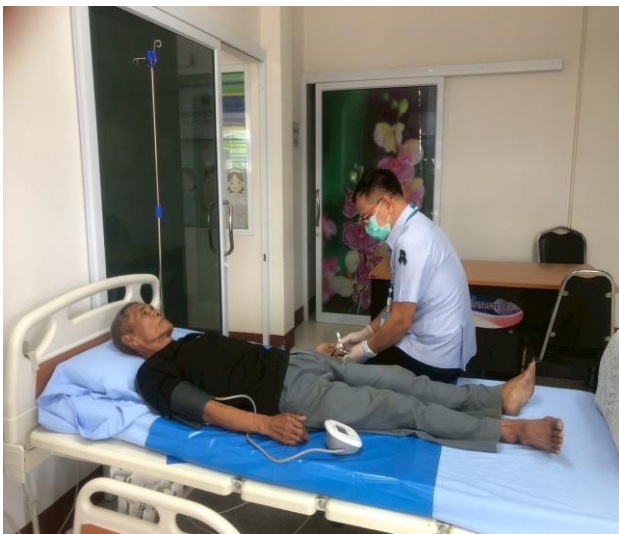
ภาพแสดง การบริการภาวะฉุกเฉินใน รพ.สต.