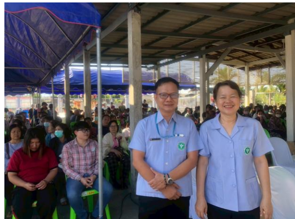
ภาพแสดง ผู้เข้าร่วมกิจกรรมภายในงาน