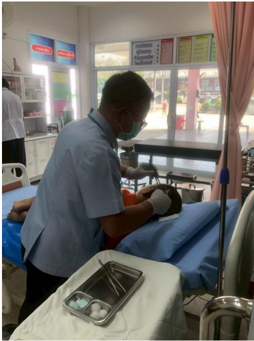
ภาพแสดง บริการหัตถการทางการพยาบาล