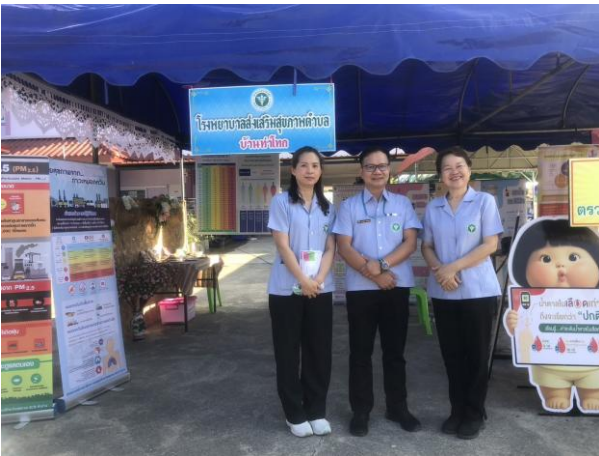
ภาพแสดง กิจกรรมสุขภาพภายในงาน