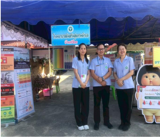
ภาพแสดง ผอ.รพ.สต.และ พยาบาล NP ประจำการ