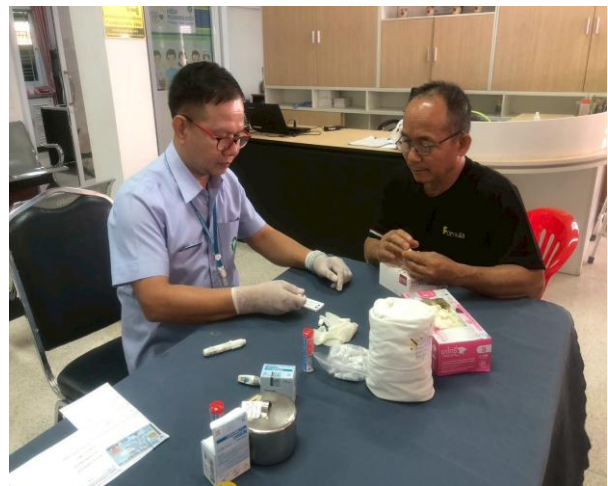
ภาพแสดง บริการตรวจคัดกรอง ไวรัสตับอักเสบบี, ซี