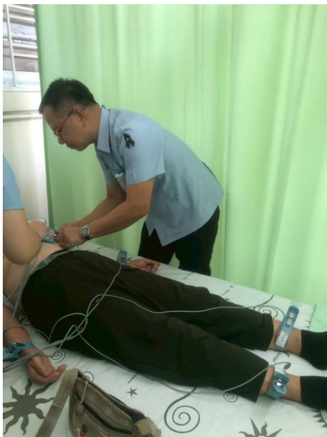
ภาพแสดง การตรวจคลื่นไฟฟ้าหัวใจ