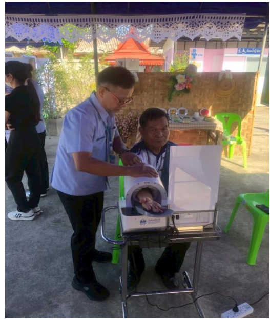
ภาพแสดง การบริการตรวจวัดสัญญาณชีพ