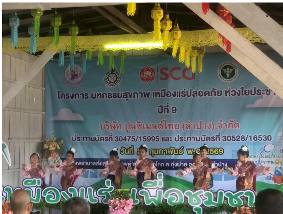
ภาพแสดง กิจกรรมการแสดงของเด็กนักเรียนในชุมชน