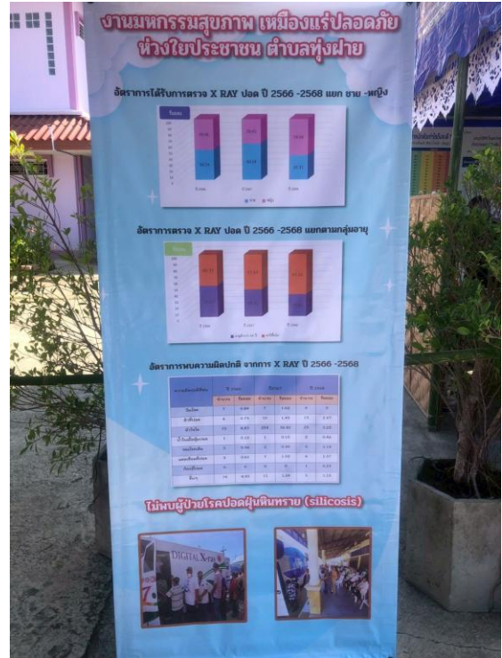
ภาพแสดง นิทรรศการความรอบรู้ด้านสุขภาพ