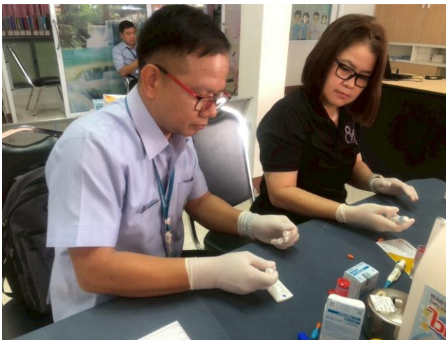
ภาพแสดง ร่วมบริการตรวจคัดกรอง ไวรัสตับอักเสบบี, ซี