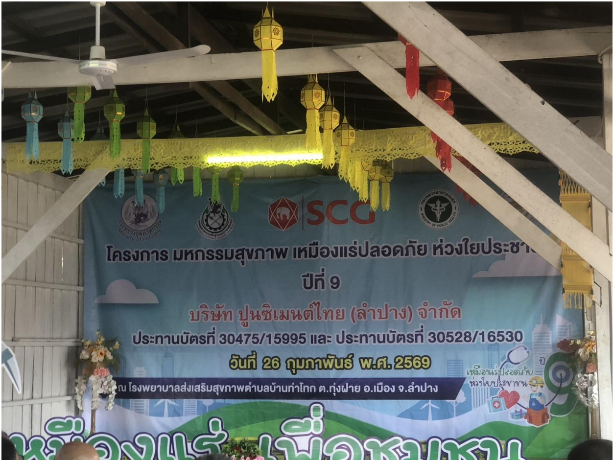
ภาพแสดง การบริการและร่วมทำกิจกรรม มหกรรมสุขภาพ วันที่ 26 กุมภาพันธ์ พ.ศ. 2569